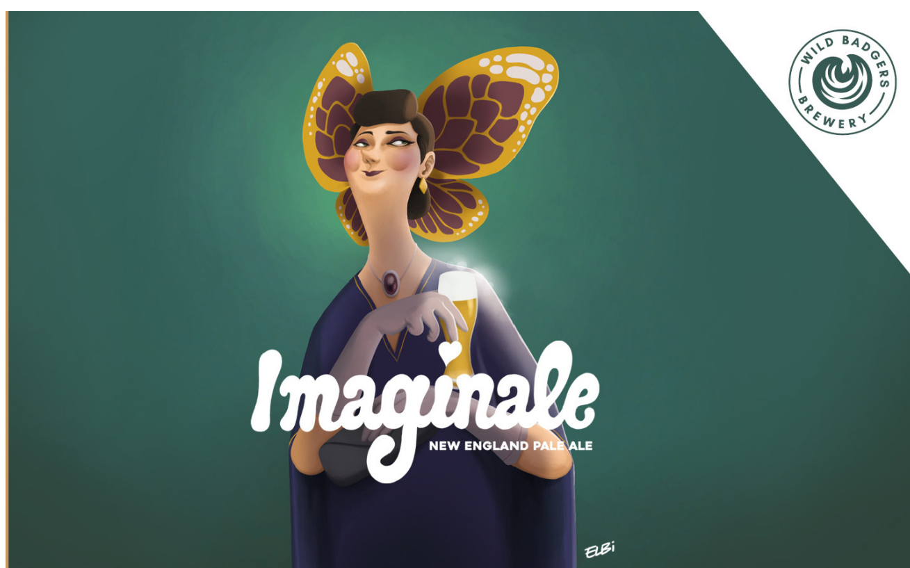
Wild Badgers brewery