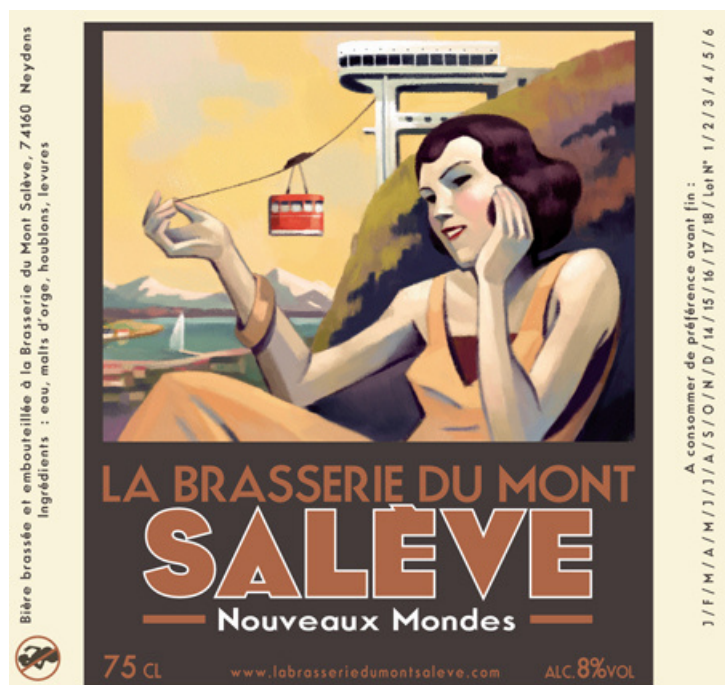
Brasserie du Mont Salève